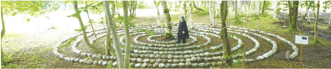
いのちの森「水輪」には、日本で初めてダマヌールの方たちが作られた石の螺旋があります。ぜひ樹々とその土地の自然の精霊たちとのコンタクトをしてみてください。

樹々は私たちの地球に生きている大きなアンテナです。夏至・冬至に、樹々は宇宙に私たちの惑星の健康状態について発信受信をします。人間が自然を破壊しているせいで、何年も前から彼らのメッセージは絶望で悲嘆にくれるものになっていましたが、ダマヌール市民とこのプロジェクトを支えるすべての人たちの熱意により、しだいに調和的關係へと変わりつつあります。